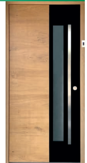
HAUSTÜRE design: Modell 9050

Individuelle FENSTER vom Profi im eigenen Unternehmen hergestellt. Fordern Sie unverbindlich unsere Fenster-Broschüre an. Die Palette unserer Holz- HAUSTÜREN erfüllt alle Gestaltungswünsche. Von klassisch bis modern. Fordern Sie unverbindlich unsere Haustüren-Broschüre an.