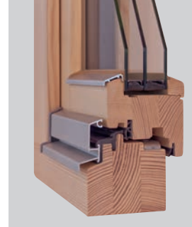
HOLZ: S HF Effizient 78 oder 84