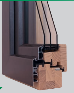
HOLZ-ALU 78: S HAF Effizient 78, eckig