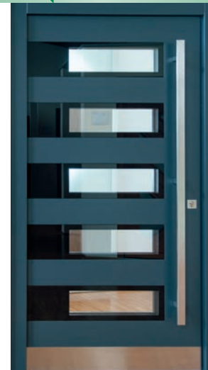
HAUSTÜRE design: Modell 7100