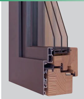
HOLZ-ALU 78: S HAF Contour 78, eckig, flächenversetzt