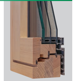
HOLZ-ALU 78: S HAF Contour, flächenbündig

Selbstverständlich fertigen und liefern wir auch F 30 + F 90 Brandschutzfenster.