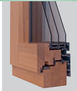
HOLZ-ALU 78: S HAF Contour 78, Aluminium flächenbündig