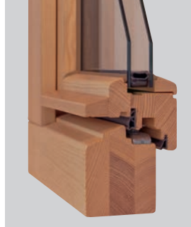
HOLZ: S HF Denkmal 58