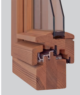
HOLZ: S HF Zier 68