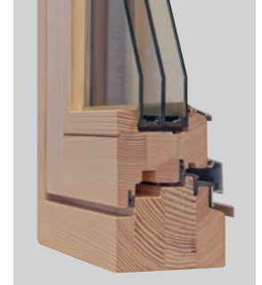
HOLZ: S HF Effizient 84, innen flächenbündig