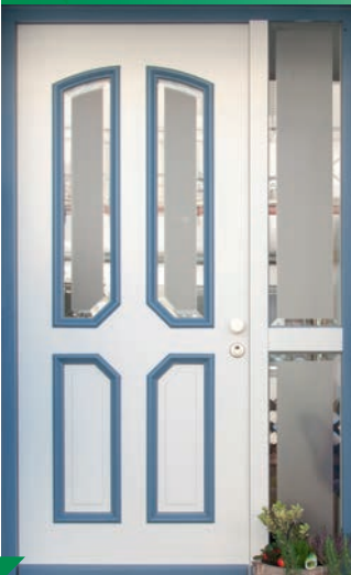
HAUSTÜRE design: Modell 2900