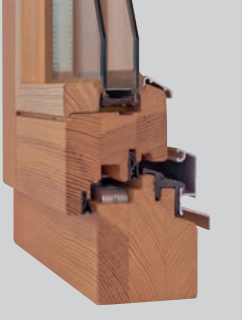
HOLZ: S HF Standard 68, Glasstab, innen eckig