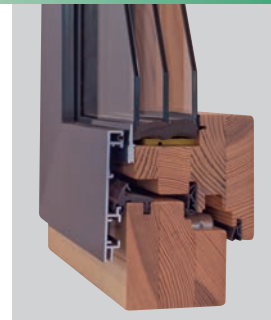
HOLZ-ALU 78: S HAF Integral