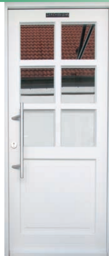
HAUSTÜRE design: Modell 3050